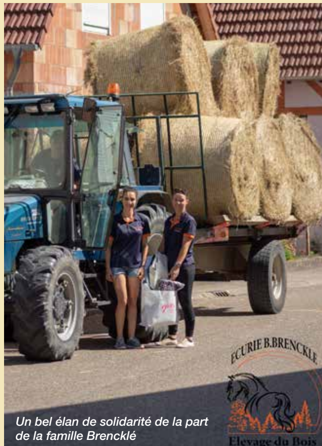
Un bel élan de solidarité de la part de la famille Brencklé

Contact : Estelle Hoffarth 06 61 70 42 53