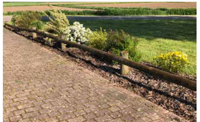
Allée fleurie de la salle des fêtes qui petit à petit grandit